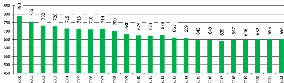
Serie storica imprese registrate