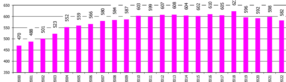
Serie storica imprese registrate